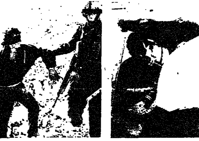
جدي اسرائيلي يقتل شابا في القدس المحتلة وامرأة عربية تحول نزع العصبية عن عينيه